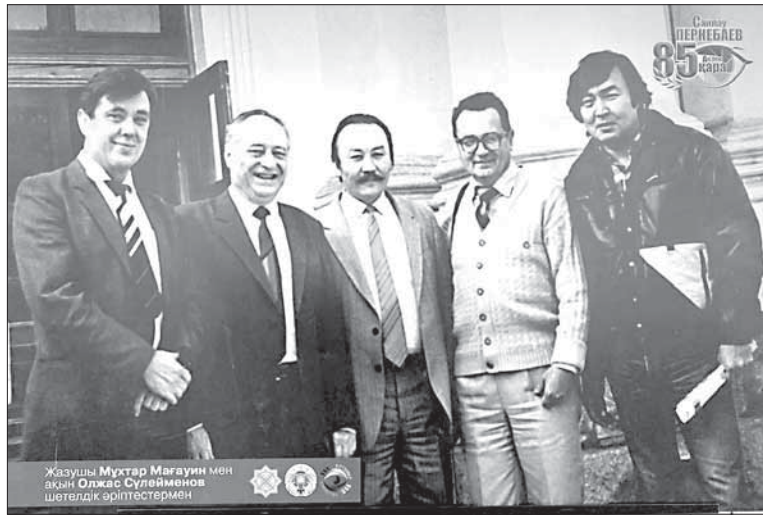
Жазушы Мұхтар Мағауин мен ақын Олжас Сүлейменов шетелдік әріптестерімен

Мерейтой аясында «Поэмалар кітабының» тұсаукесері өтті. Бұл басылымға Олжас Сүлейменовтің классикалық поэмаларымен қатар,