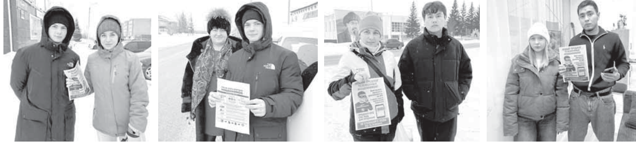
Бұланды аудандық жастар ресурстық орталығы.

Бұланды ауданының Жастар ресурстық орталығы интернет-алаяқтықтың алдын алу бойынша акция өткізді. Акция аясында тұрғындарға қарапайым тілмен түсіндірілген жадынамалар таратылды. Ол жадынамаларда: