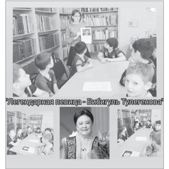
«Легендарная певица - Бибигуль Тулегенова»

В ходе встречи присутствующие узнали о творческом пути Бибигуль Ахметовны - от её первых шагов на музыкальной сцене до признания на международном уровне. Особое внимание было уделено заслугам и достижениям великой певицы, её значительному вкладу в развитие оперного искусства и популяризацию казахской музыки.