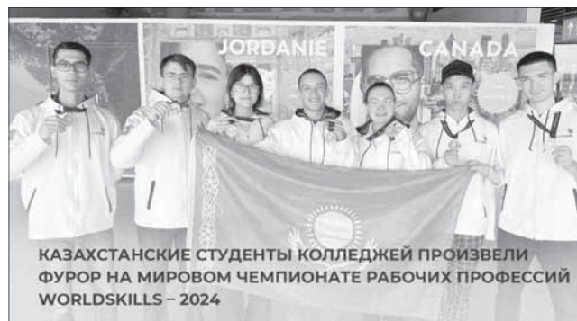
КАЗАХСТАНСКИЕ СТУДЕНТЫ КОЛЛЕДЖЕЙ ПРОИЗВЕЛИ ФУРОР НА МИРОВОМ ЧЕМПИОНАТЕ РАБОЧИХ ПРОФЕССИЙ WORLDSKILLS – 2024