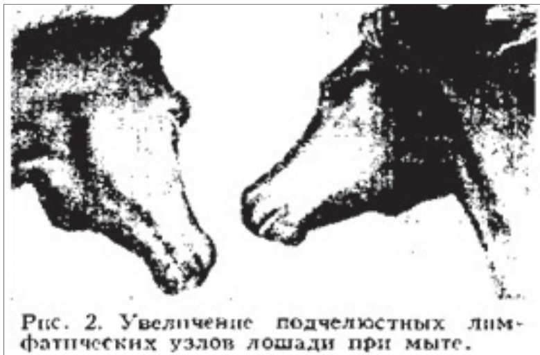
Рис. 2. Увеличение подчелюстных лимфатических узлов лошади при мыте.

По всем вопросам обращаться: ГУ «Буландынская районная территориальная инспекция Комитета ветеринарного контроля и надзора МСХ РК» тел.: 2-15-09, ул. Яглинского, 42, 2 этаж.