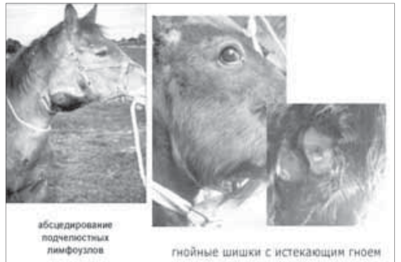
абсцедирование подчелюстных лимфоузлов

Диагноз ставят по эпизоотологическим данным (одновременное заболевание молодых лошадей), клиническим признакам (лихорадка, катар слизистой оболочки носовой полости, воспаление